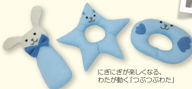
にぎにぎが楽しくなる、わたが動く「つぶつぶわた」