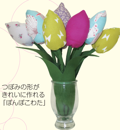
つぼみの形がきれいに作れる「ぼんぼこわた」