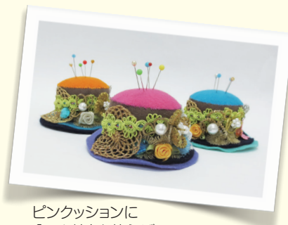
ピンクッションに「ラビッシュ」を使えば、針通しもスムーズ