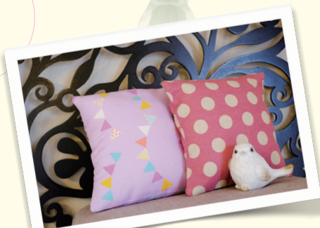
40x40cmのクッションなら、わたは300gが目安