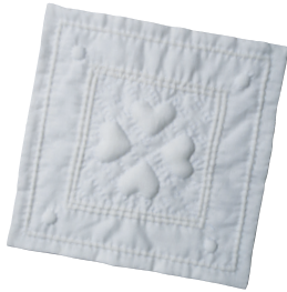
風合い重視の作品には、柔らかでボリュームのある「つや綿」を