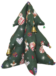
自立する作品には、形がしっかり保てる「クラフトわた」を

空気を含み具合や繊維の加工方法によって、柔らかさやボリューム感が変わってきます。形をしっかり保ちたい、あるいは手触りにこだわりたいなど、作品の大きさや形、仕上がりによって、最適のアイテムをお選びください。