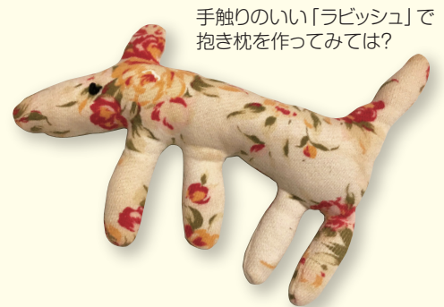
手触りのいい「ラビッシュ」で抱き枕を作ってみては?