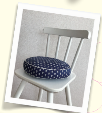
座布団には、しっかりした「クラフトわた」がおすすめ!